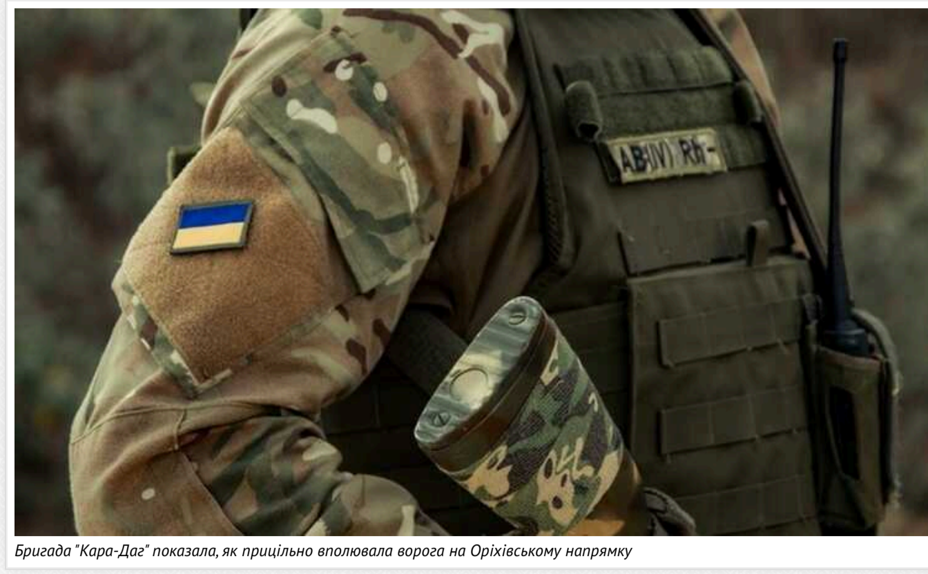
Бригада "Кара-Даг" показала, як прицільно вполювала ворога на Орхівському напрямку

Російські окупанти виявляють активність на багатьох ділянках фронту, зокрема й на Орхівському. Там двома загарбниками здійснили дві спроби штурму, які зупинили війни бригади "Кара-Даг".