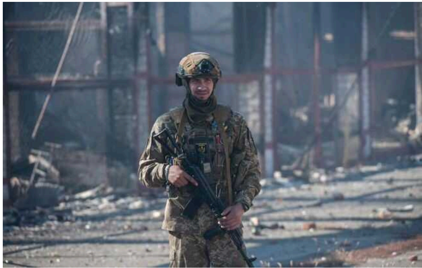
Українські захисники просунулися у Серебрянському лісі

Українські захисники провели наступальні дії у Серебрянському лісництві. Військовим вдалося просунутися.