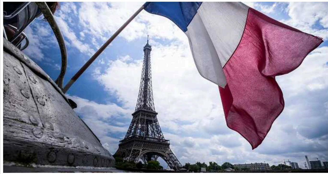
Якщо праві переможуть на парламентських виборах у Франції або очолять уряд, це ускладнить становище України, – The Sunday Times

Газета The Sunday Times пише, що якщо праві переможуть на парламентських виборах у Франції або очолять уряд, це ускладнить становище України.