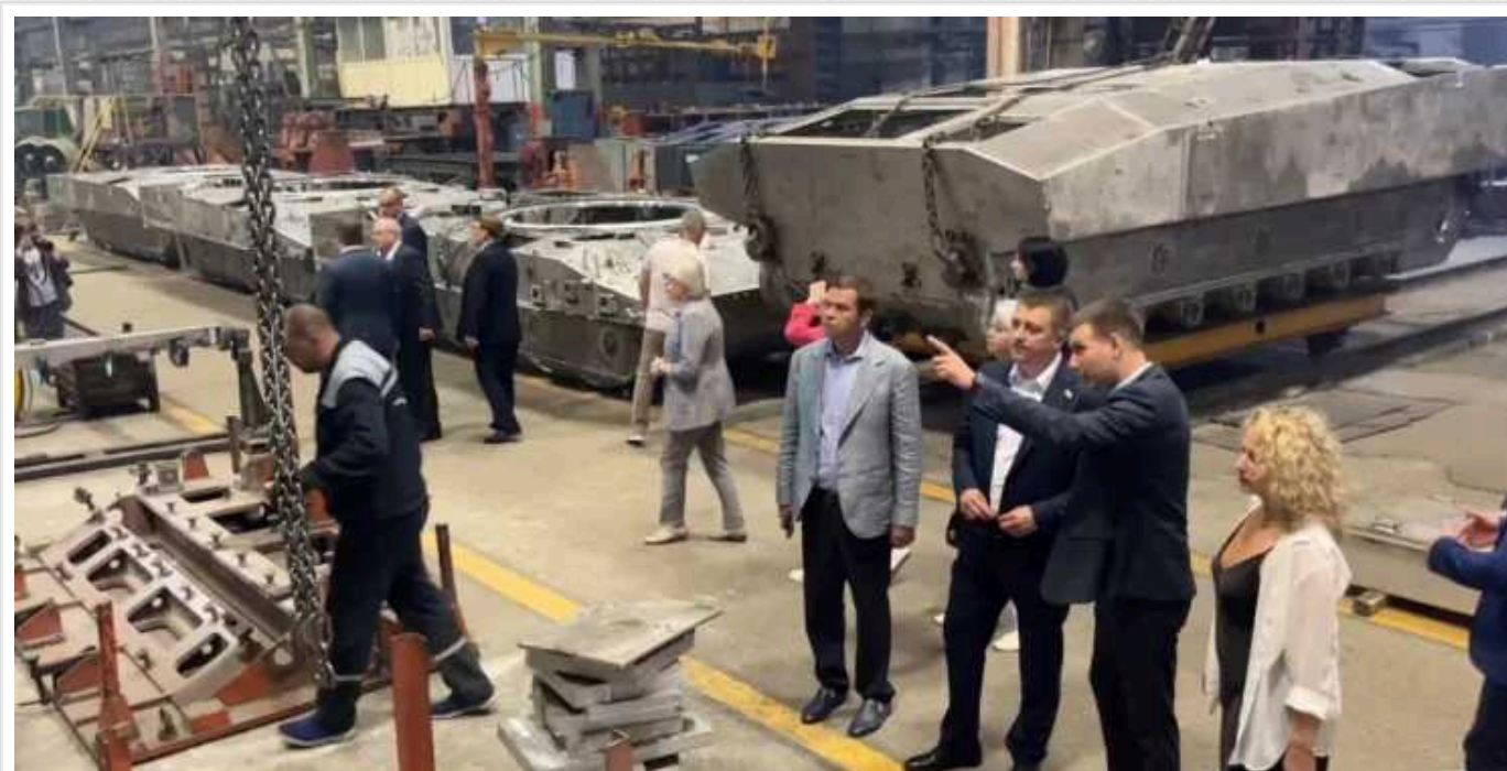
У Росії засвітили виробничу лінію нової БМ «Курганець-25»

У 2015 році з "Арматою" на параді в Москві показали низку бронетехніки разом із "Курганцем". З того часу російська армія так і не отримала ні Т-14, ні БМ до лав, окрім дослідних партій.