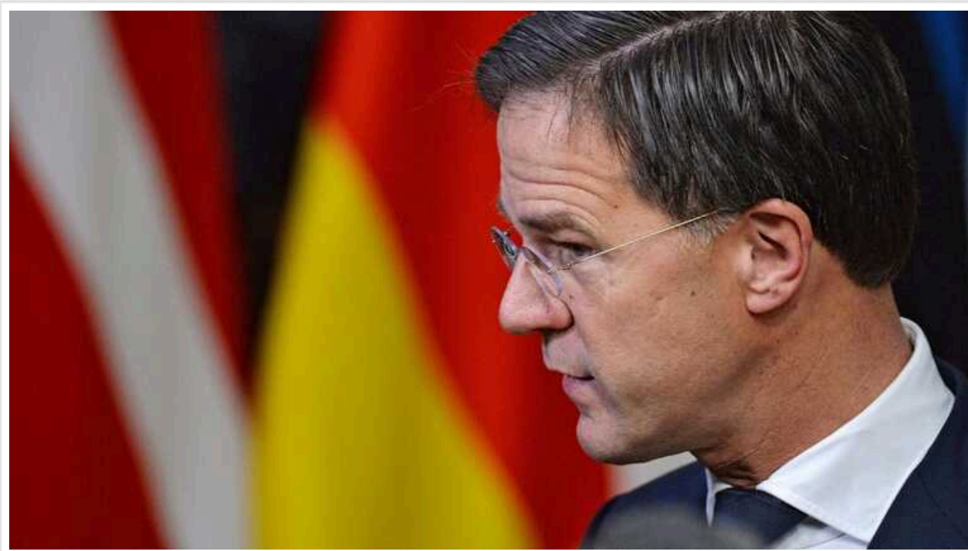
Прем'єр Нідерландів прокоментував «мирний план» Путіна

Заяву президента РФ щодо "миру" оцінив глава Нідерландів, який має всі шанси стати наступним Генсеком НАТО. Політик упевнений, що подібна заява – це справді добрі новини.