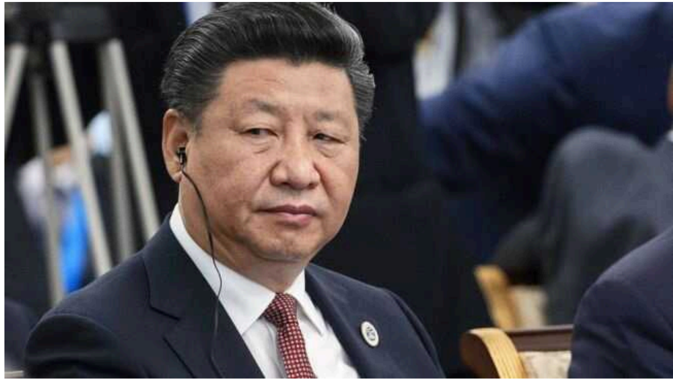
Financial Times: Вашингтон намагається спровокувати Пекін напасти на Тайвань

Financial Times повідомляє, що Вашингтон намагається спровокувати Пекін напасти на Тайвань. Про це, як стверджують джерела видання, голова КНР Сі Цзіньпін заявив голові Єврокомісії Урсулі фон дер Ляєн.