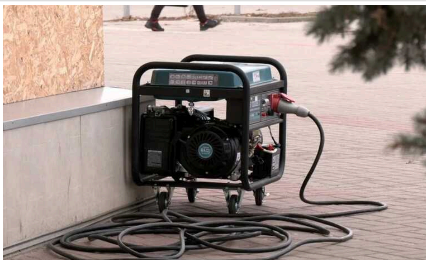
В Україні можна отримати штраф за використання генератора

Через часті відключення світла багато простих українців і підприємців почали використовувати генератори. Але в деяких випадках можна отримати чималий штраф за цю корисну техніку.