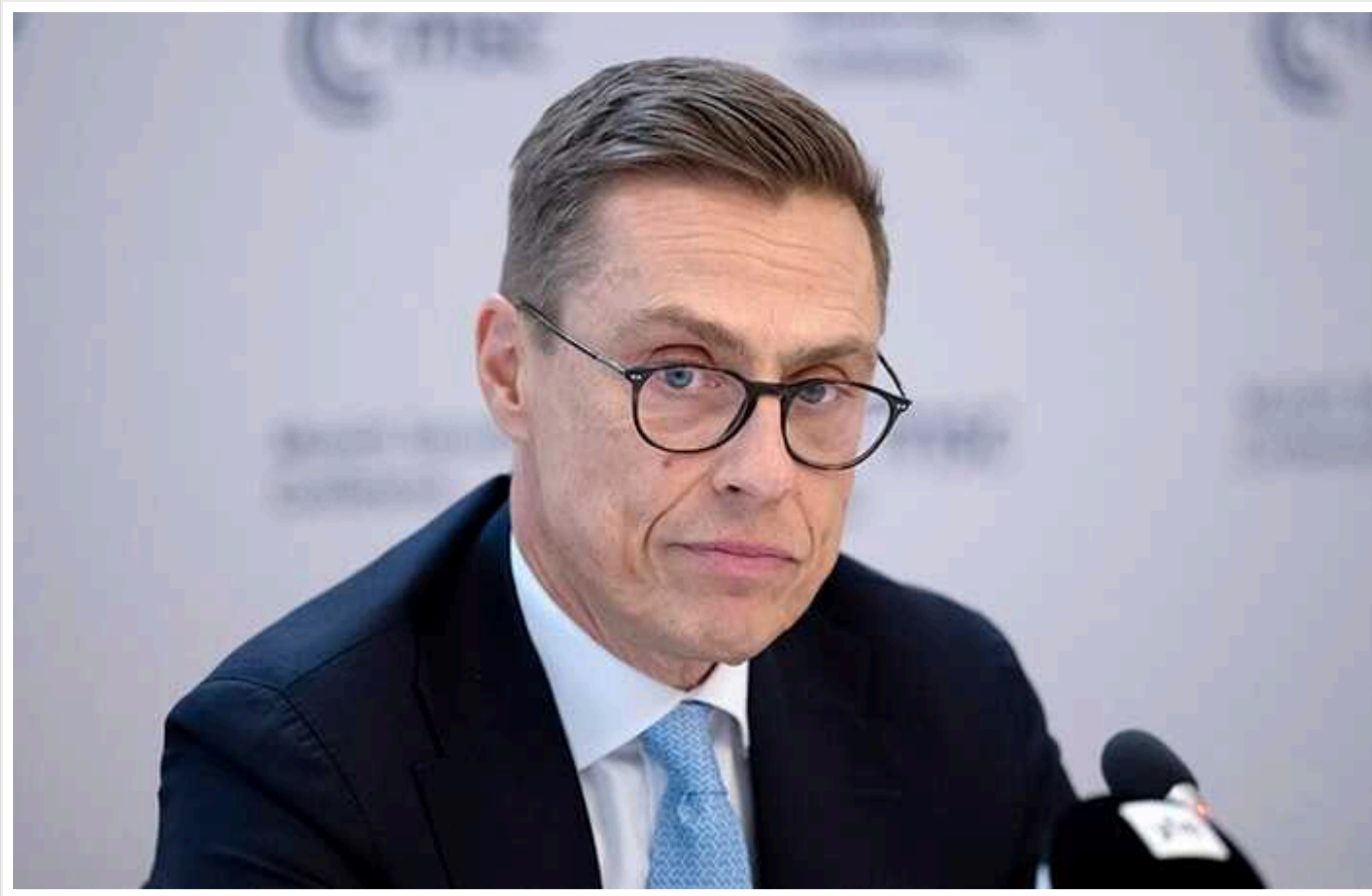
Президент Фінляндії заявив, що Китай може змусити Путіна припинити війну

Президент Фінляндії Александер Стубб, спілкуючись із журналістами на Саміті миру у Швейцарії, заявив, що Китай може відіграти ключову роль у встановленні миру в Україні.