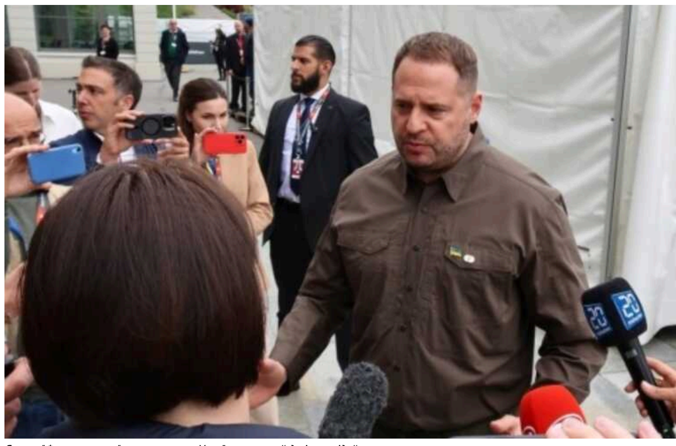
Єрмак: "Формула миру" є основою, але Україна готова й до інших ідей

"Формула миру" президента Зеленського має бути основою припинення російської війни, але Україна готова й до інших ідей та пропозицій, якщо вони поважають незалежність, територіальну цілісність та суверенітет України.