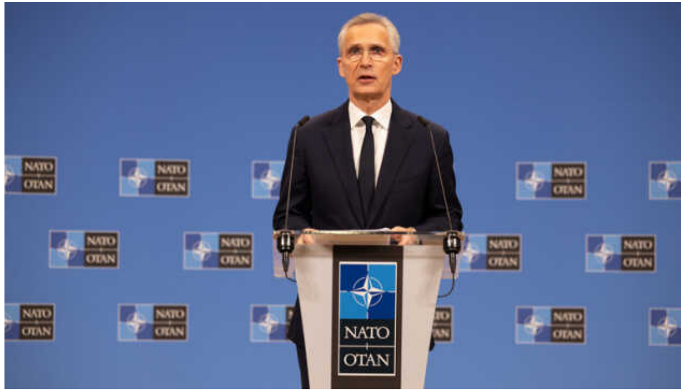
Столтенберг: Україна має право знищувати ракетні установки, з яких обстрілюють Харків

Україна має право на самозахист. Це право включає право знищувати легітимні військові цілі на території агресора – Росії.