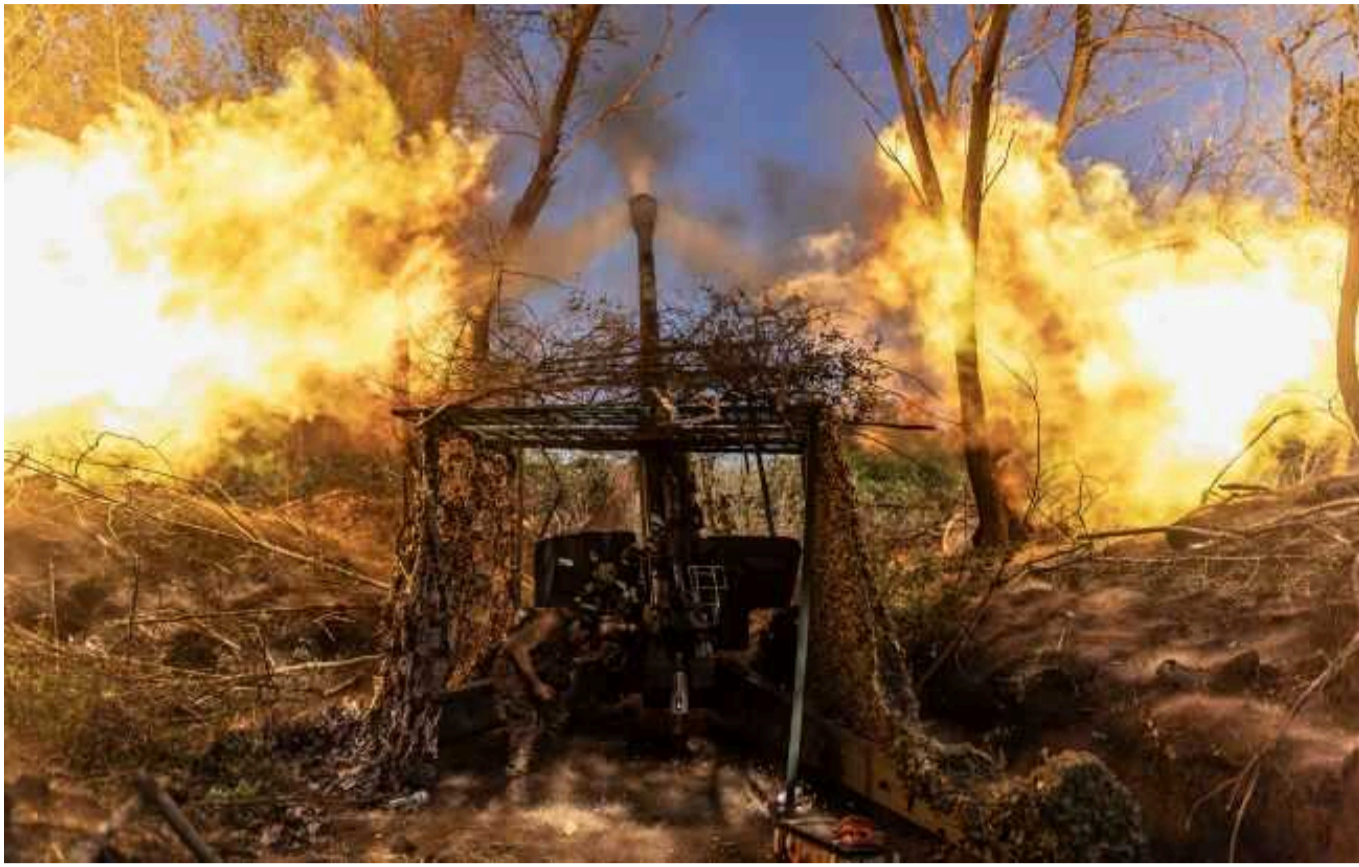
Ситуація на фронті: окупанти найбільше штурмують Покровський напрямок

15 червня окупанти намагаються активно штурмувати позиції ЗСУ на Покровському напрямку. З початку доби тут відбулася майже третина від загальної кількості боєзіткнень.