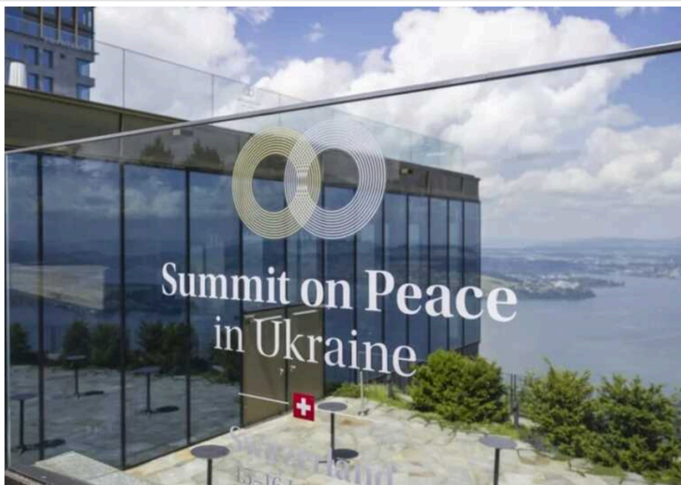
Декларацію Саміту миру досі узгоджують, її можуть підтримати не всі учасники, - ЗМІ

Переговори щодо підсумкової декларації Глобального саміту миру у Швейцарії ще тривають, організатори очікують, що документ можуть ухвалити без згоди всіх сторін.