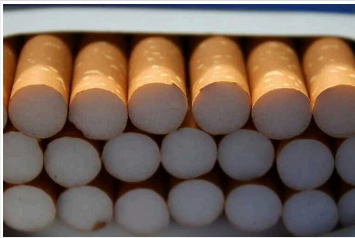
В Україні значно зміняться ціни на цигарки

В Україні в першому читанні ухвалили законопроект №11090, який призведе до значного підвищення цін на цигарки. Після першого етапу підвищення акцизів, який може статися вже 2024-го, пачка цигарок середньої цінової категорії може подорожчати з 87,14 до 92,8 грн.