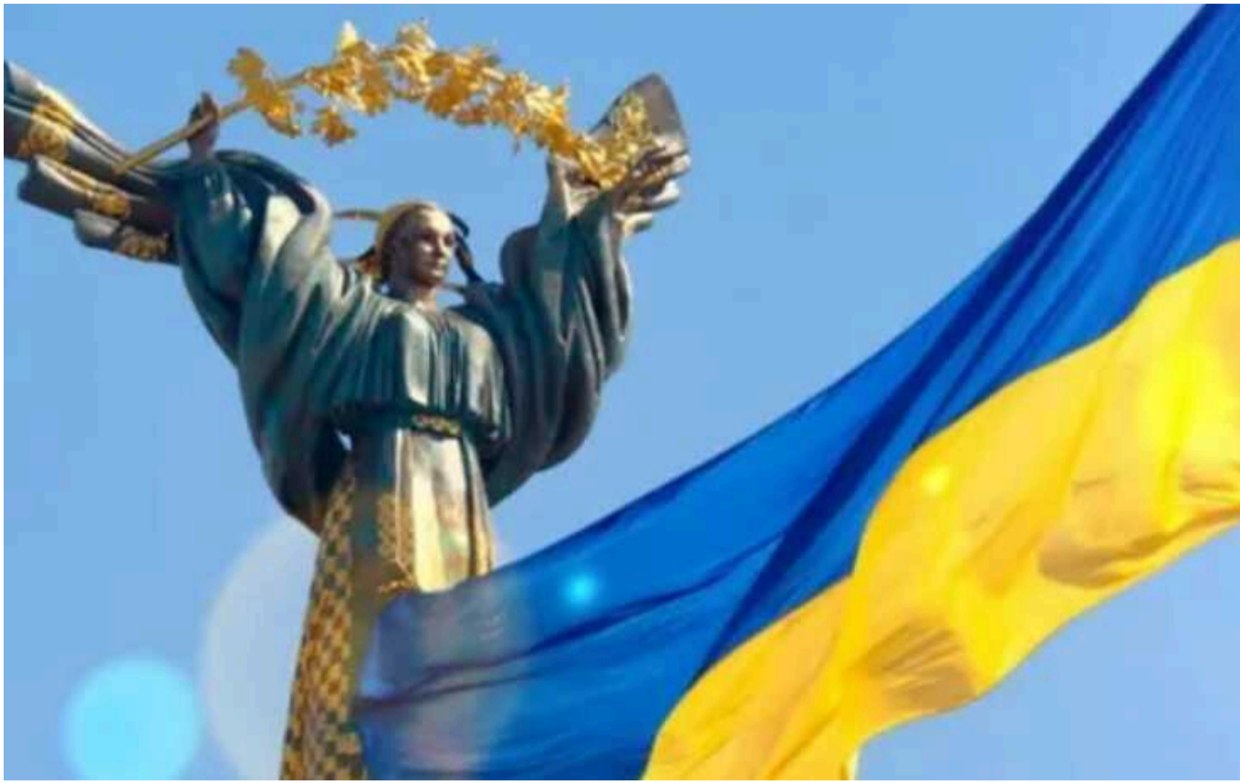
У мережі опубліковано відео про "формулу миру": як вона виникла і що означає

Офіс президента України створив документальний фільм, присвячений "формулі миру", яку Україна пропонує для справедливого закінчення війни. Фільм детально розкриває концепцію "формули миру" та умови, на які готова погодитися Україна для досягнення справедливого та стійкого миру.