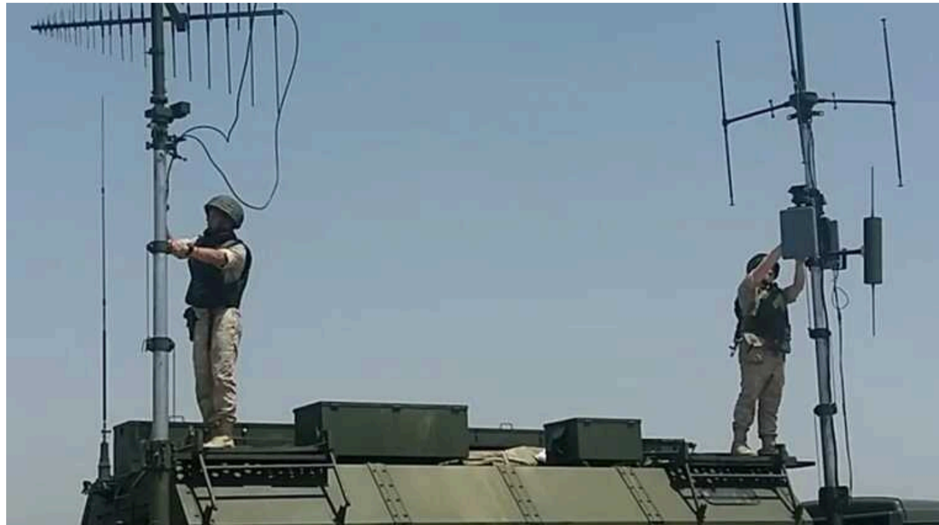
Українські десантники знищили РЕБ-станцію окупантів "Синиця"

Українські десантники продовжують знищувати на фронті рідкісну та дорогу техніку російської окупаційної армії. Нещодавно захисники завдали вогневого ураження по станції радіоелектронної боротьби "Синиця".