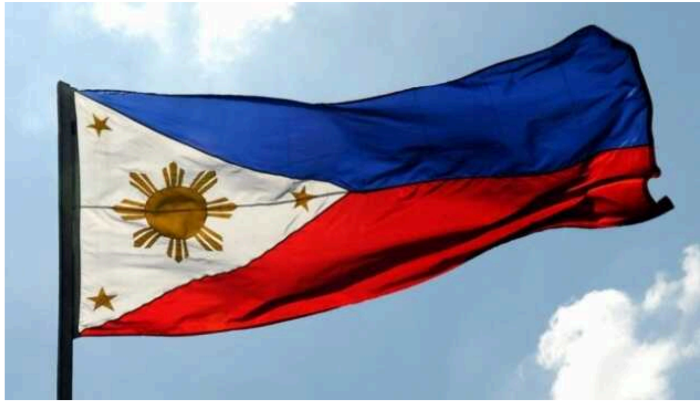
Філіппіни заявили в ООН про свої права на ресурси Південно-Китайського моря

Філіппіни звернулися до комісії Організації Об'єднаних Націй з проханням офіційно визнати протяжність свого підводного континентального шельфу в Південно-Китайському морі, де вони матимуть виключне право на розробку ресурсів.