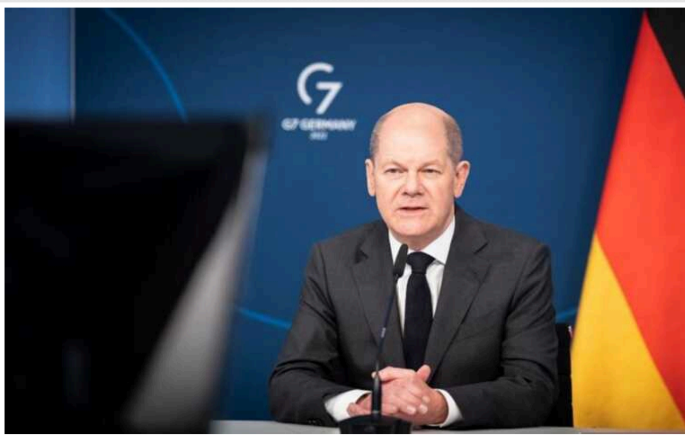
Шольц підтримує запрошення РФ на наступний Саміт миру

Канцлер Німеччини Олаф Шольц вважає, що в майбутньому Росія має бути залучена до саміту миру, де обговорюватиметься шлях завершення її повномасштабного вторгнення в Україну.