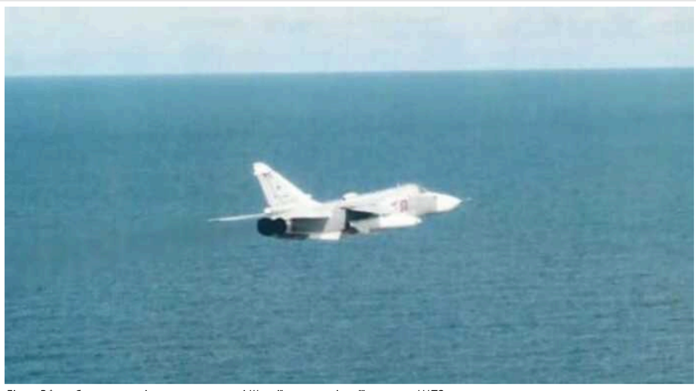
Літак РФ «заблукав» у повітряному просторі Швеції, вперше після її вступу в НАТО

Швеція ввечері 14 червня зафіксувала порушення повітряного простору російським бомбардувальником Су-24.