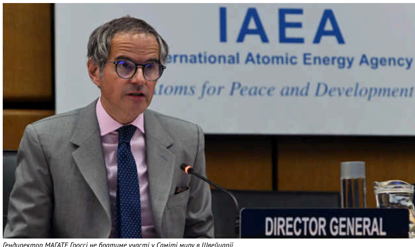
Гендиректор МАГАТЕ Гроссі не братиме участі у Саміті миру в Швейцарії

Генеральний директор МАГАТЕ Рафаель Маріано Гроссі не братиме безпосередню участь у першому Саміті миру, який стартує у суботу в швейцарському Бюргенштоці, оскільки не хоче змішувати політичні аспекти з технічною роботою агентства.