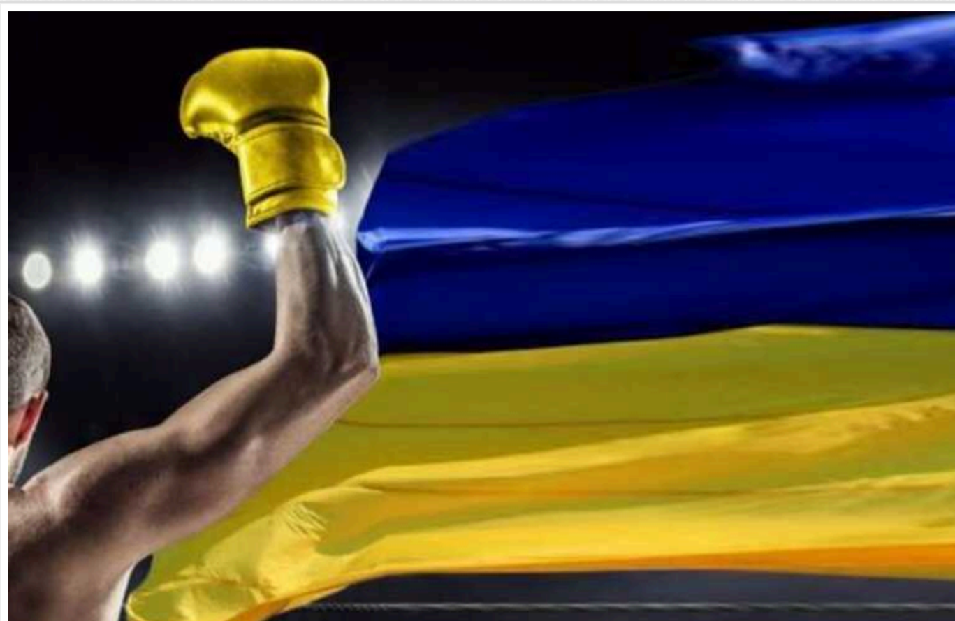
Рейдери-ухиянти та напад на ЗМІ: як спроба узурпації ФБУ вплине на долю українського боксу?

За півтора місяця до старту літніх Олімпійських ігор у Парижі в українському боксі розгорівся гучний скандал. Представники спортивної спільноти та правники заявляють про рейдерське захоплення профільної всеукраїнської федерації.