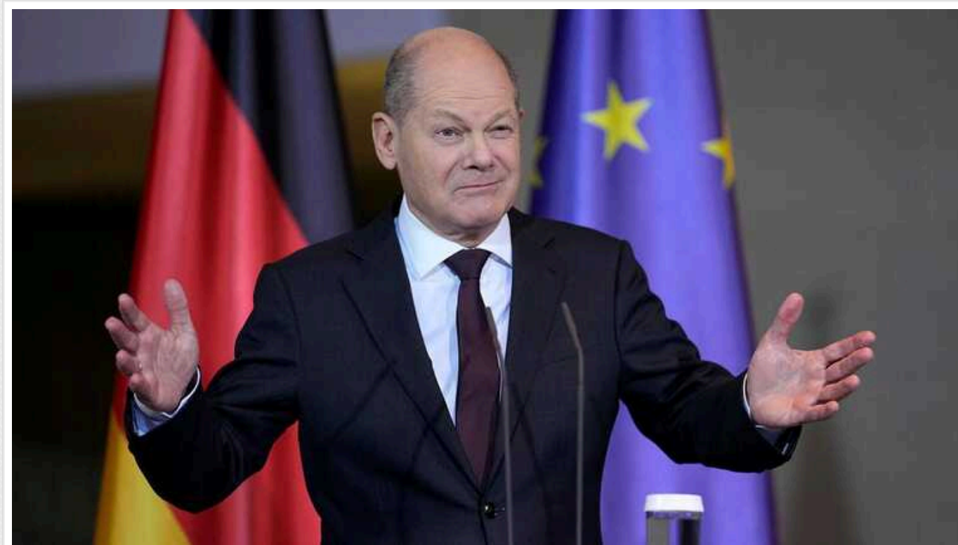
Ультиматуми Путіна це «несерйозна пропозиція», – Шольц

Канцлер Німеччини Олаф Шольц вважає, що так звана "пропозиція" росіянина Володимира Путіна з ультимативними вимогами до України має на меті відволікти увагу світу від Глобального саміту миру у Швейцарії.