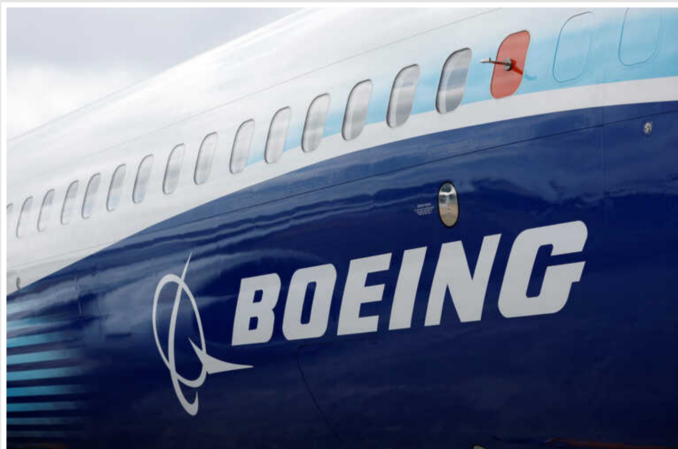
Reuters дізналося про нову проблему в компанії Boeing

Федеральне авіаційне управління США співпрацює з компанією, щоб забезпечити негайне виправлення виробничої системи