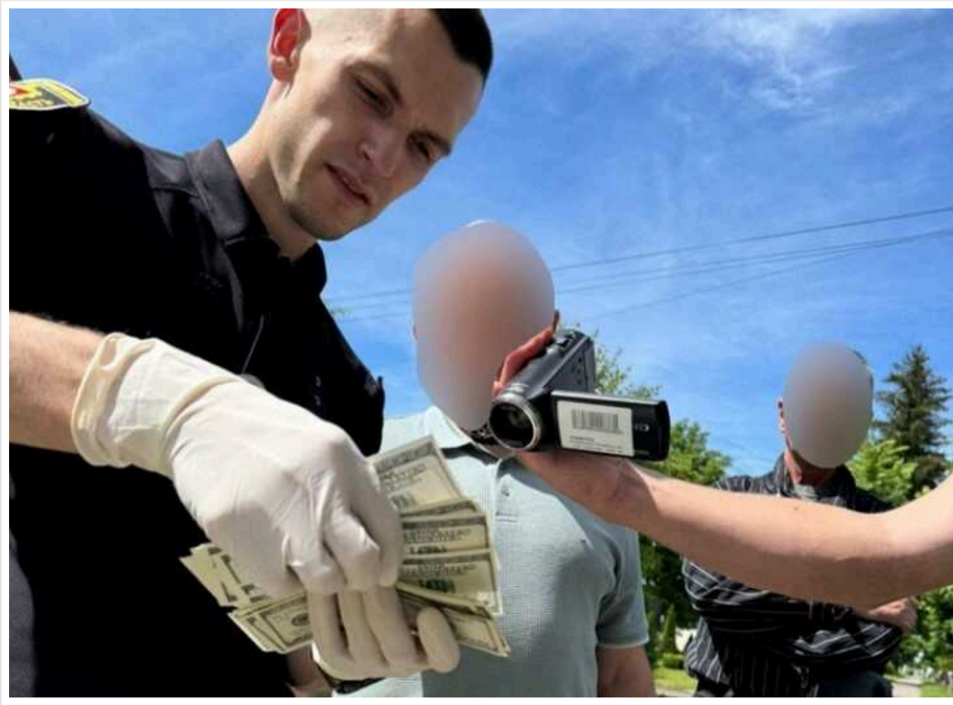
На Рівненщині поліцейські затримали посадовця, який за 4 тисячі доларів хотів вплинути на членів виконкому

Неправомірну вигоду фігурант отримав двома траншами: спочатку – тисячу доларів США, а днями, під час отримання ще трьох тисяч, його затримали правоохоронці.