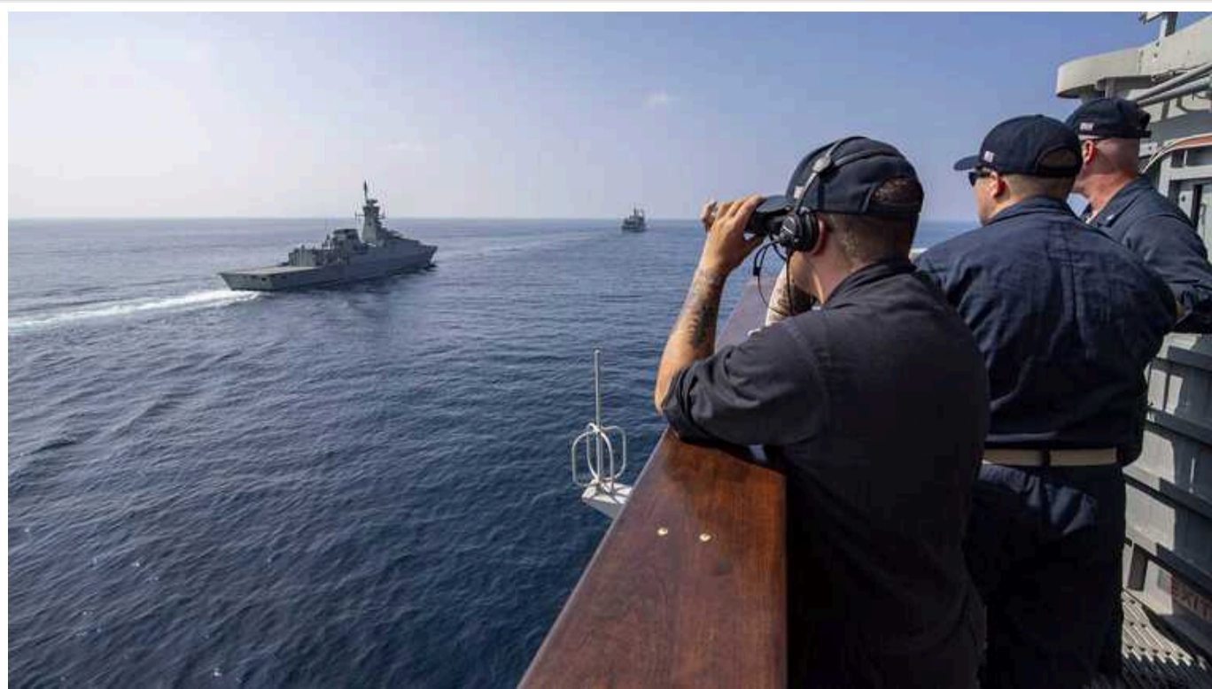
У Червоному морі американські військові знищили радары та дрони хуситів

Американські військові заявляють, що знищили в Червоному морі надводні дрони, безпілотники і радары, які належали єменським хуситам.