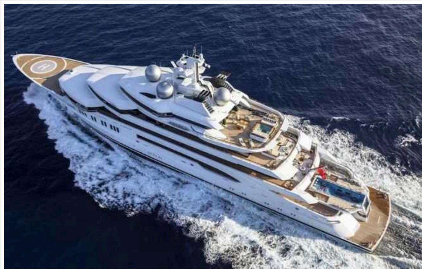
Суд у США не дозволив уряду продавати арештовану яхту російського олігарха Керімова

Суд Нью-Йорка (США) відмовив уряду в праві продати розкішну яхту Amadea російського бізнесмена, що була арештована ще у 2022 році. Кошти від реалізації судна планувалося передати на користь України.