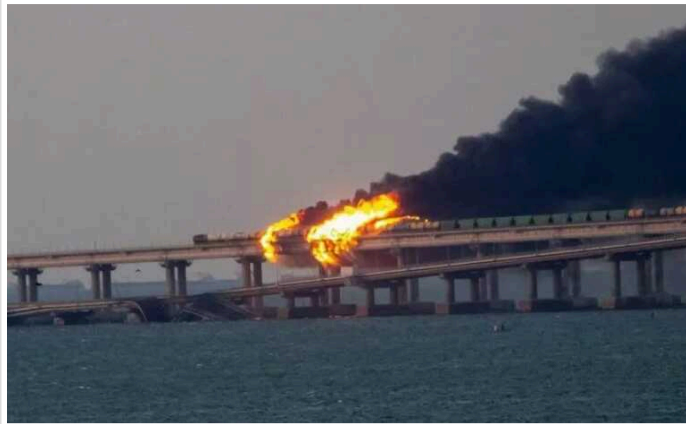
Партизани виявили позицію ПЗРК окупантів у районі Кримського мосту й натякнули на «бавовну»

Агенти партизанського руху "АТЕШ" у Криму виявили позицію зенітно-ракетного комплексу окупантів у районі Кримського мосту. Тепер на тимчасовий (за визначенням партизанів) "Керченський міст" очікує "бавовна".