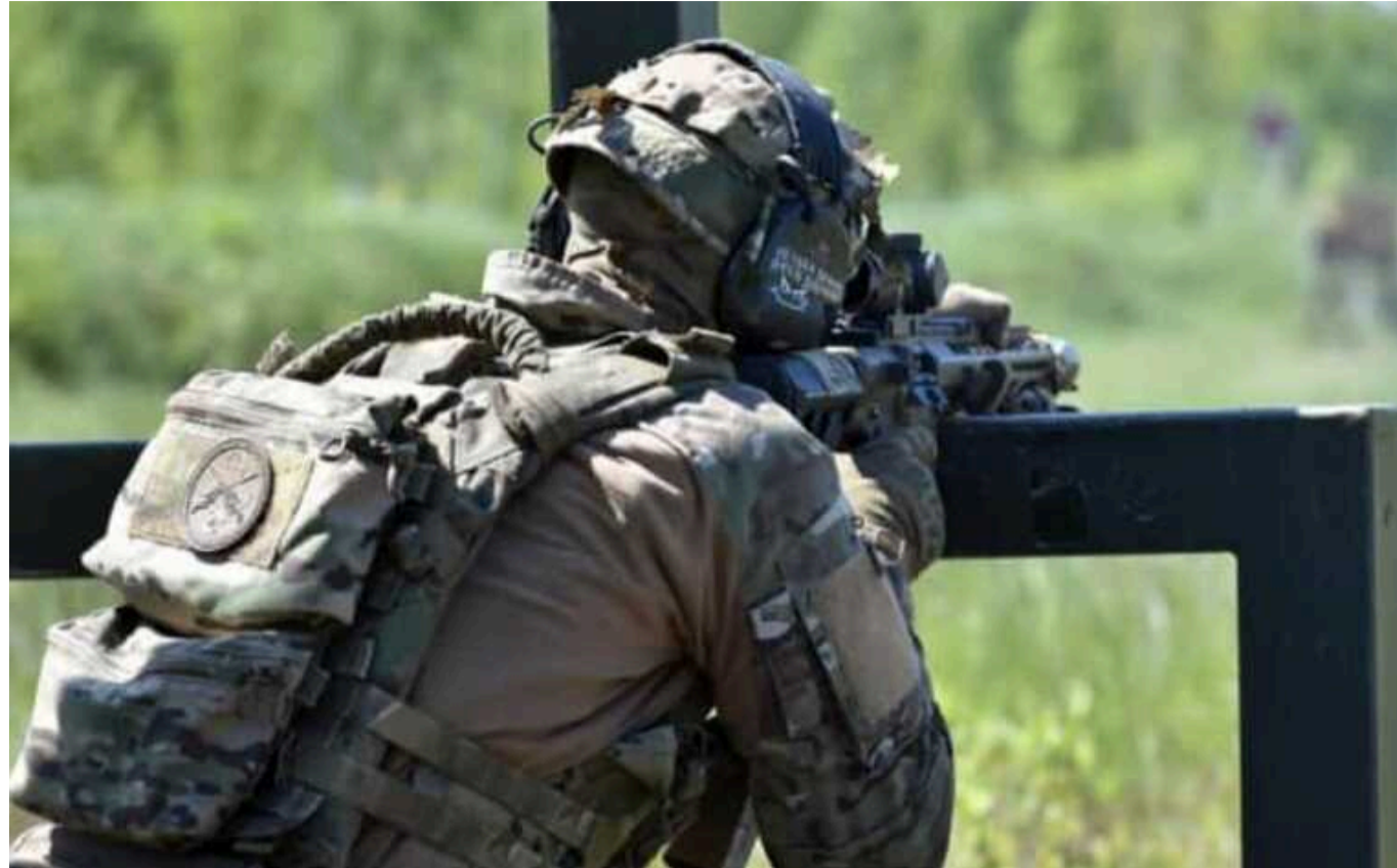
Кримчанин через Вірменію дістався материкової України, щоб воювати проти Росії

У тимчасово окупованому росіянами Криму проти 32-річного мешканця Сімферопольського району порушили кримінальну справу після того, як він виїхав на материкову частину України через Вірменію, щоб воювати проти Росії.