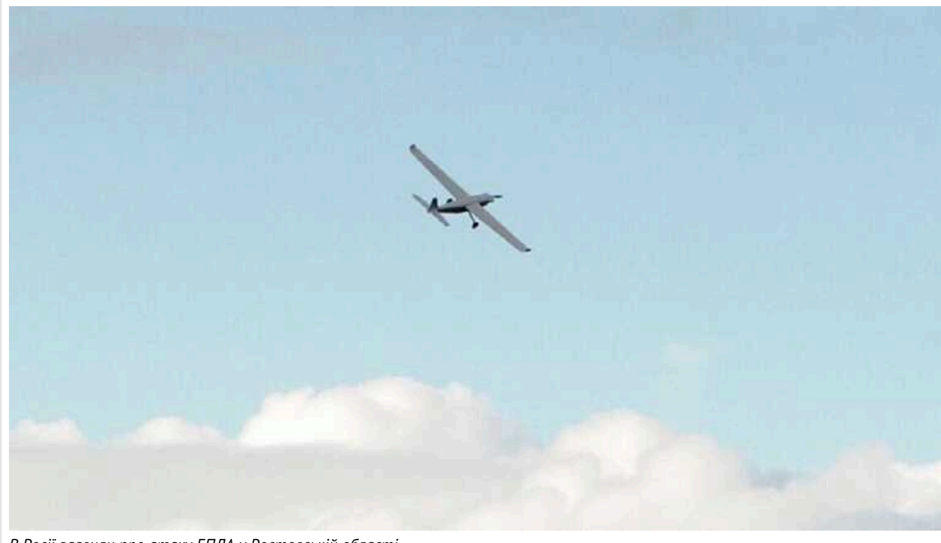
В Росії заявили про атаку БПЛА у Ростовській області

Росіяни повідомляють про атаку дронів у Ростовській області та про роботу своєї ППО в районі Каменська-Шахтинського.