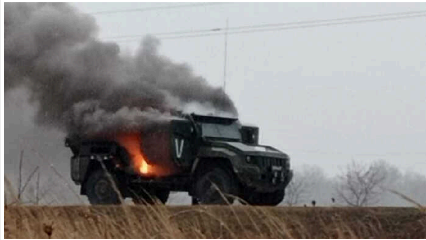
Втрати ворога: ЗСУ ліквідували 1090 окупантів, знищили 20 танків та 37 артсистем

За минулу добу Сили оборони знешкодили на полі бою 1090 російських загарбників, уразили 20 танків та 37 артилерійських систем.