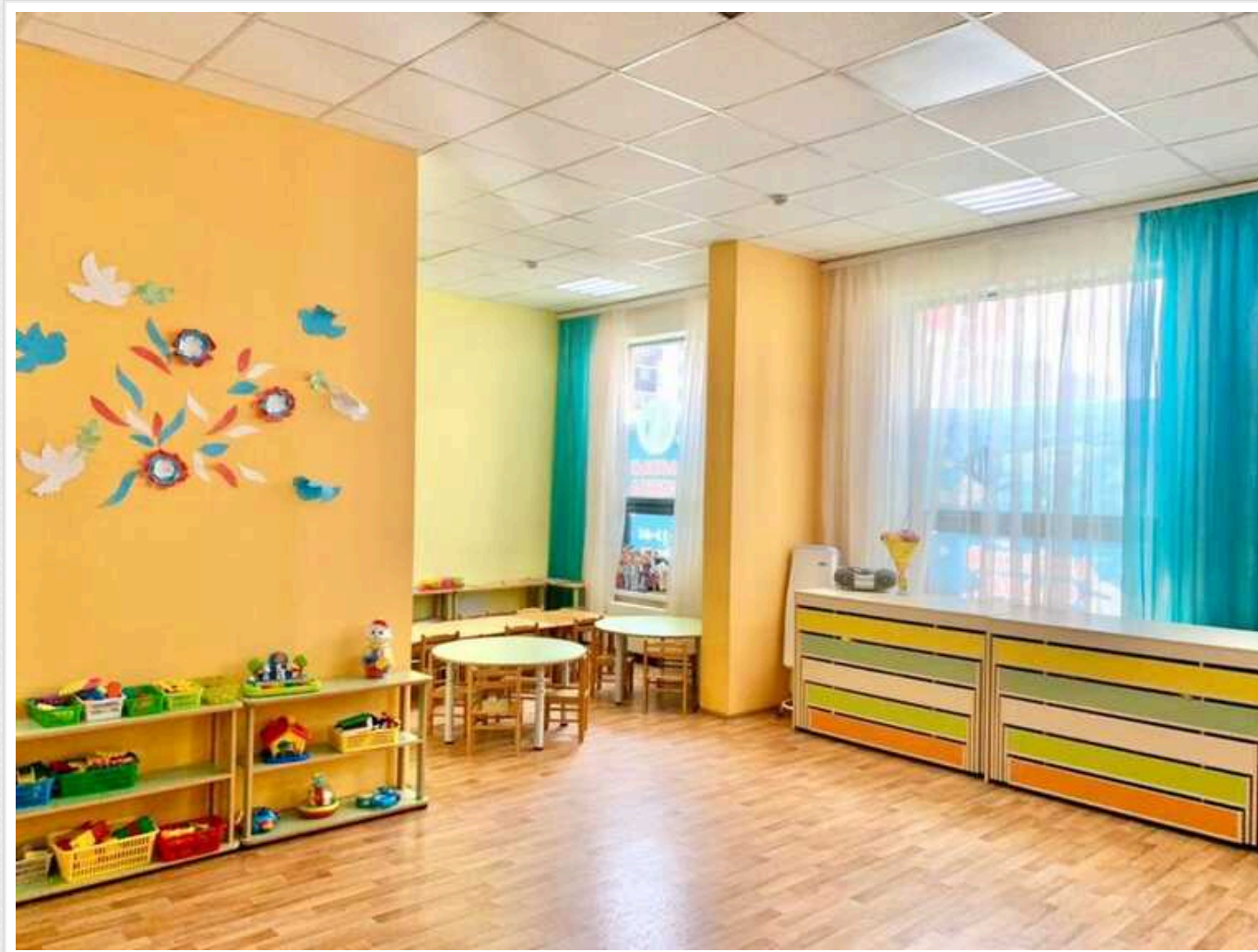
На Одещині у дитсадку цькували 2-річну дитину

В Одеській області працівники дитячого садку жорстоко поводилися з дворічною дитиною. Місцеві журналісти знайшли у мережі допис матері дівчинки.