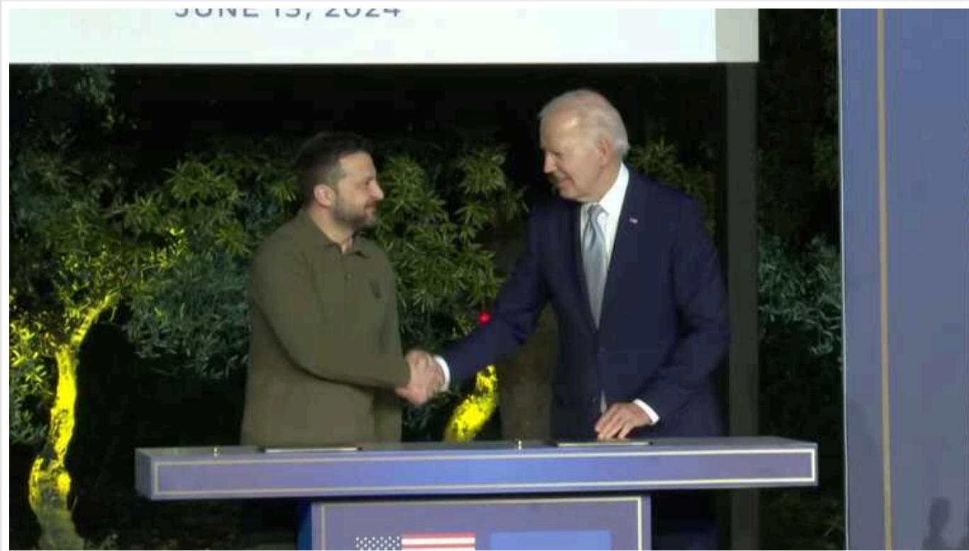
Безпекова угода із США: Зеленський висловлює занепокоєння щодо пункту, згідно з яким Вашингтон може розірвати угоду