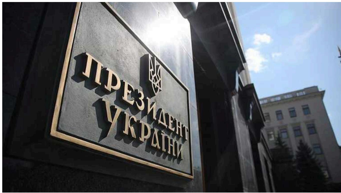
КНР відійшла від свого першого мирного плану, який починався з відновлення українського суверенітету

У першому мирному плані Китаю стосовно російської агресії проти України пунктом номер один було відновлення територіальної цілісності та суверенітету. Нова ж пропозиція не відображає ті початкові намагання КНР повернутися до міжнародного права.