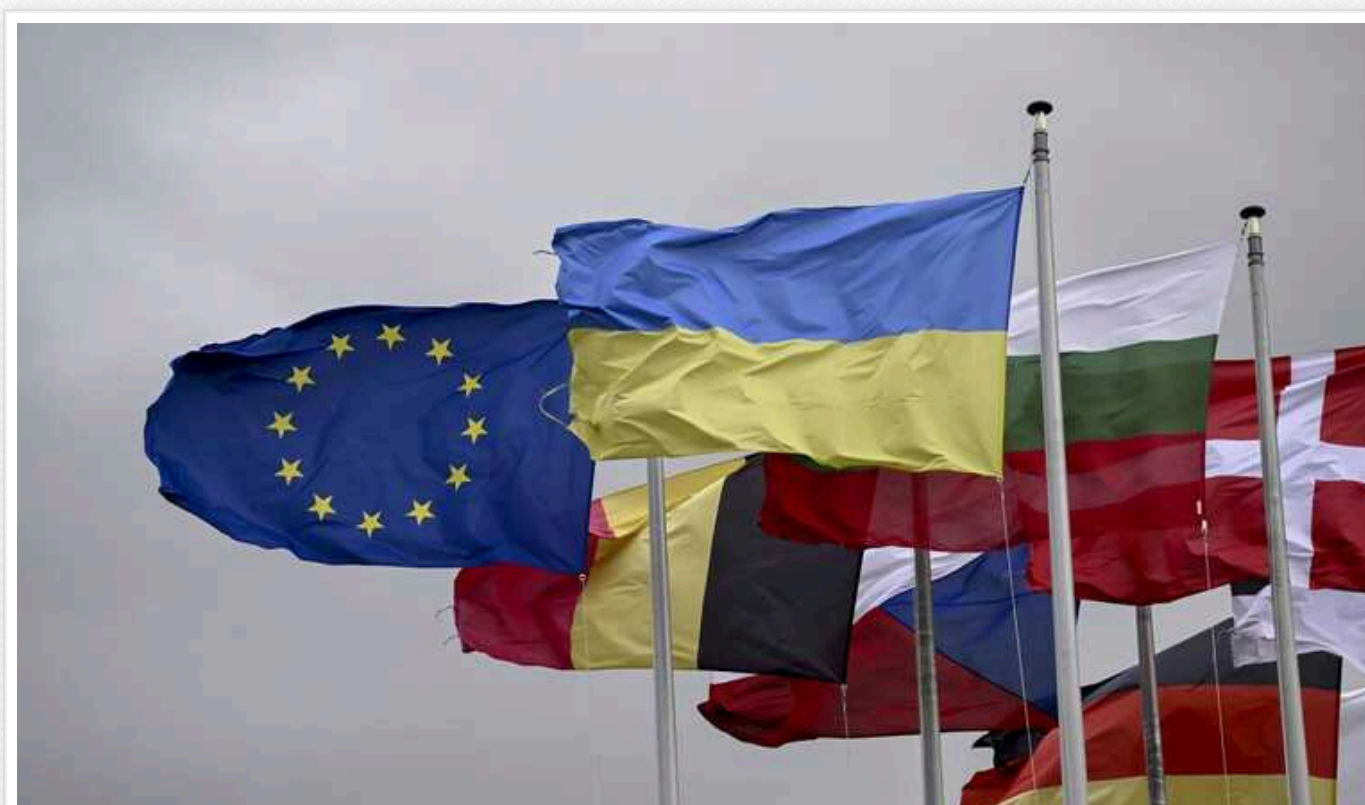
У Швейцарії оприлюднили повний список учасників Саміту миру по Україні

Федеральна рада Швейцарії оприлюднила остаточний перелік країн-учасниць українського Саміту миру, який відбудеться 15-16 червня.