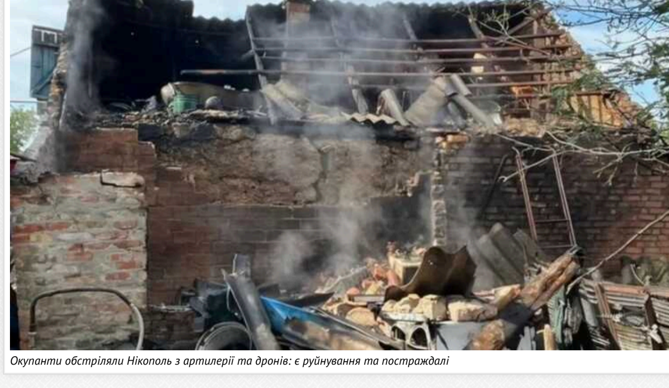
Окупанти обстріляли Нікополь з артилерії та дронів: є руйнування та постраждалі

У п'ятницю, 14 червня, Нікопольщина перебувала під ворожим вогнем. Агресор застосував БПЛА та залп з важкої артилерії. Про це повідомив очільник Дніпропетровської ОВА Сергій Лисак. Під час обстрілу було поранено 17-річну дівчину.