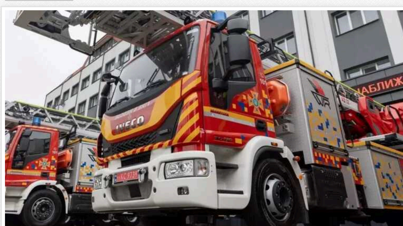
ДСНС отримала спецавтомобілі від партнерів з Японії, Великої Британії, США та Естонії

Державній службі з надзвичайних ситуацій передали 69 одиниць спецтехніки від іноземних партнерів із Великої Британії, США, Естонії та Японії, частина з яких закуплена з бюджету України. Церемонія передачі спецавтомобілів для регіональних підрозділів ДСНС відбулася у Києві 14 червня.