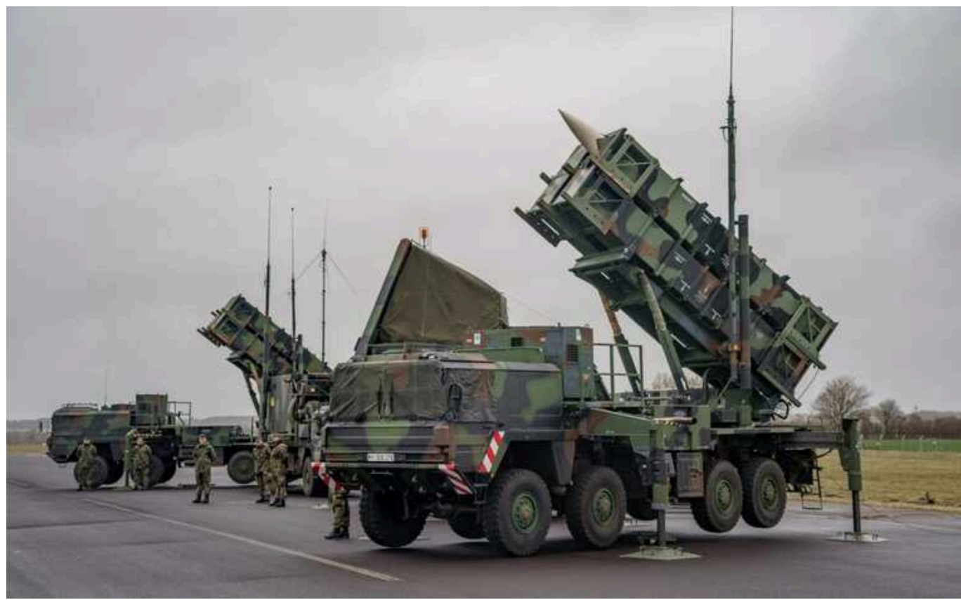
Румунія офіційно взяла на озброєння другу систему Patriot

Румунські Збройні сили 14 червня офіційно взяли на озброєння другий зенітно-ракетний комплекс Patriot, приданий у Сполучених Штатах.