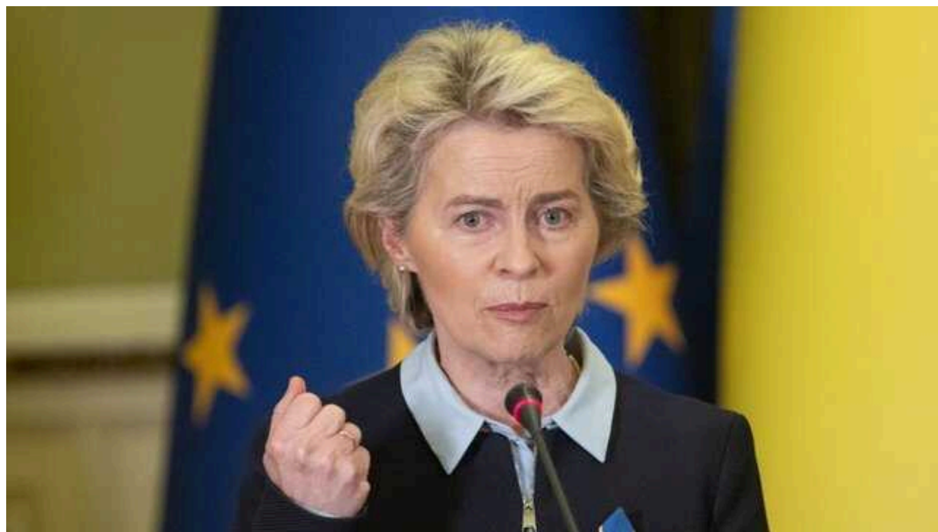
Німеччина підтримає переобрання фон дер Ляєн, - Reuters

Уряд канцлера Німеччини Олафа Шольца запропонує президентці Єврокомісії Урсулі фон дер Ляєн другий термін на зустрічі лідерів Євросоюзу в понеділок.