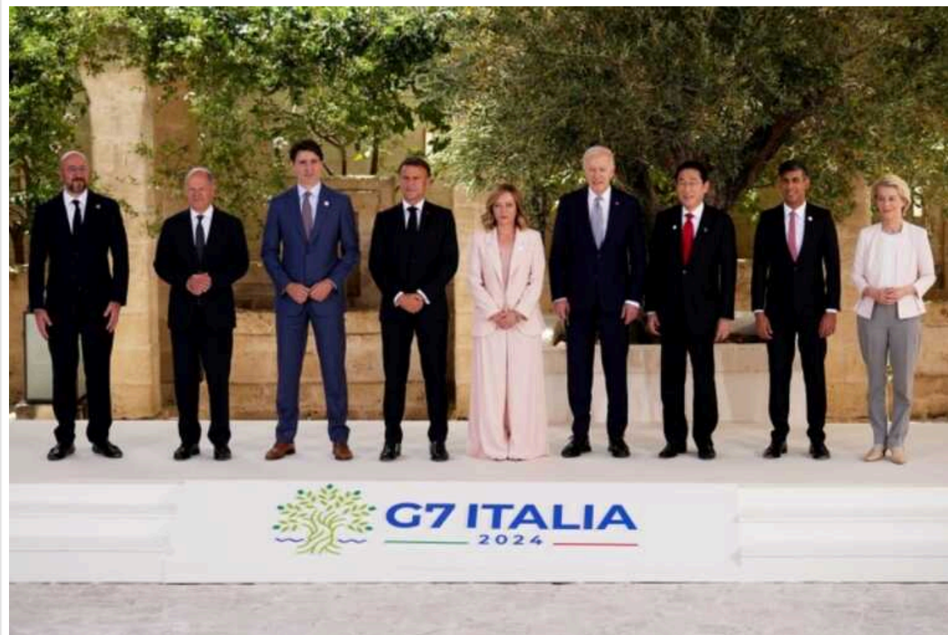
Bloomberg: G7 готує нові заходи проти тіньового флоту РФ

Учасники саміту G7 внесуть до комюніке заяви про посилену імплементацію стелі цін на нафту, а також заходи проти нових енергетичних проєктів Кремля та експорту металів.