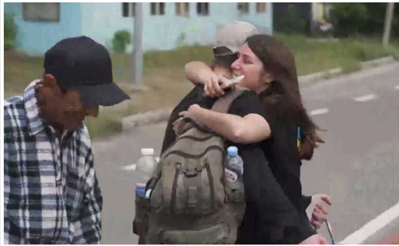
З Росії та тимчасово окупованих територій вдалося повернути ще 14 дітей

Команда Save Ukraine повідомила, з Росії та тимчасово окупованих територій вдалося повернути додому ще 14 дітей.