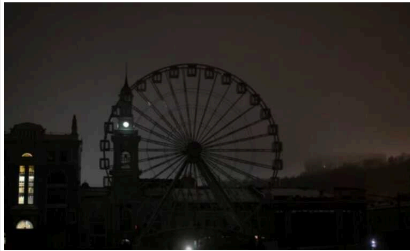
Наступного тижня ситуація в енергосистемі буде відчутно складнішою, ніж цього, –“Укренерго”

За словами голови правління «Укренерго», уникнути відключень побутових споживачів не вдасться.