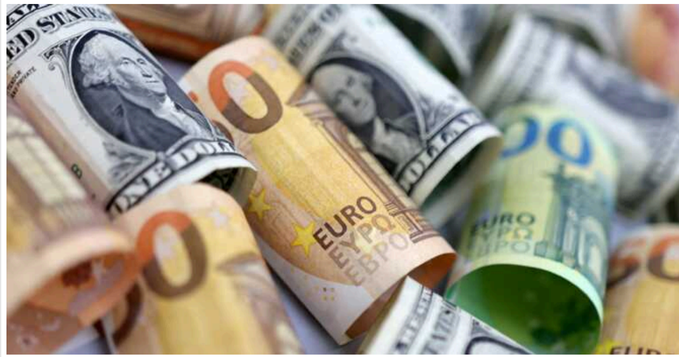
Росія має виплатити збитки в 486 мільярдів доларів, завдані Україні, – заява G7

Провідні світові держави об'єдналися у вимозі до Російської Федерації виплатити суму у 486 мільярдів доларів на відшкодування збитків, завданих українській стороні внаслідок широкомасштабного вторгнення.