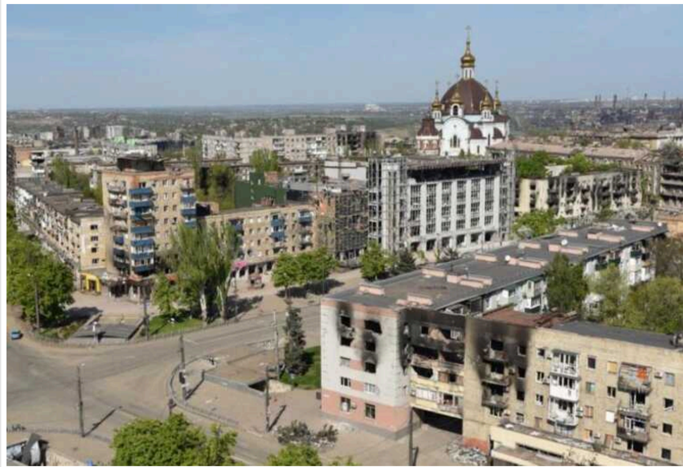
В окупованому Маріуполі загарбники почали продавати гаражі українців, що виїхали з міста

Окупанти продають і зруйновані, і вцілілі гаражі.