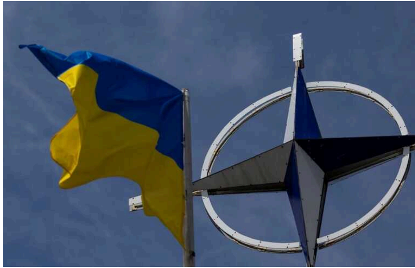
НАТО схвалило оперативний план розширення підтримки України

Міністри оборони країн НАТО схвалили "оперативний план розширення підтримки України". Він містить у собі більшу роль Альянсу в постачанні зброї та навчанні українських військових.