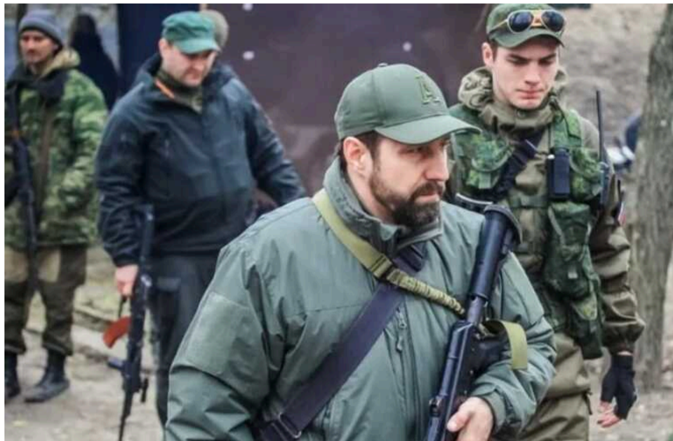
Зрадник Ходаковський поскаржився, що в армії Путіна бракує сил навіть на захоплення Донеччини

Поки російські пропагандисти обіцяють Росії грандіозні перемоги в Україні, окупанти на фронті налаштовані значно скептичніше. Так званий польовий командир "ДНР" Олександр Ходаковський, наприклад, не вірить не лише у здатність РФ захопити Миколаїв та Одесу, а й у те, що окупаційній армії вистачить сил вийти навіть на адмінкордон Донецької області.