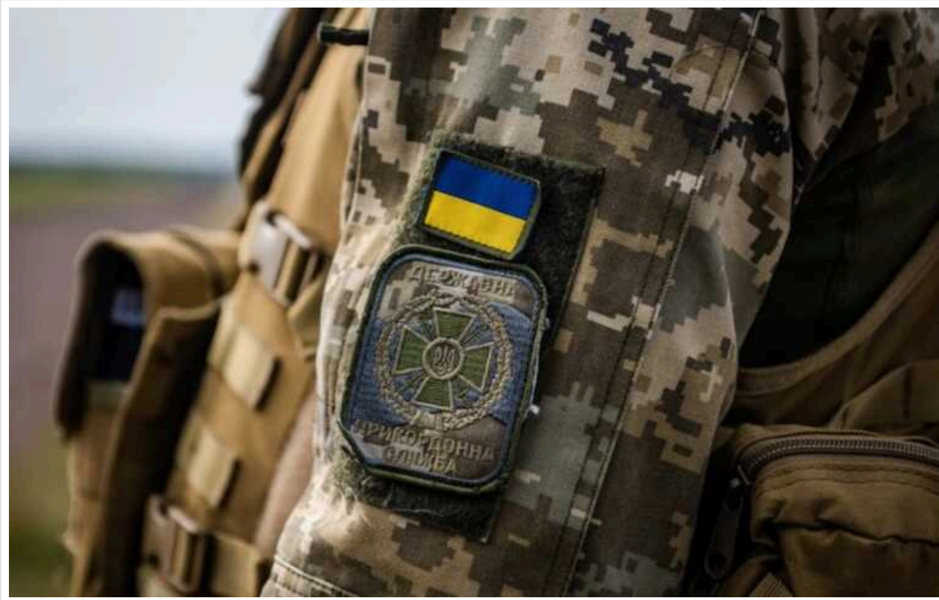
Прикордонники на Вовчанському напрямку знищили дві землерийні машини окупантів

Українські прикордонники продовжують нищити ворога поблизу Вовчанська на півночі Харківщини. Там вони за допомогою дронів знищили дві російські землерийні машини.