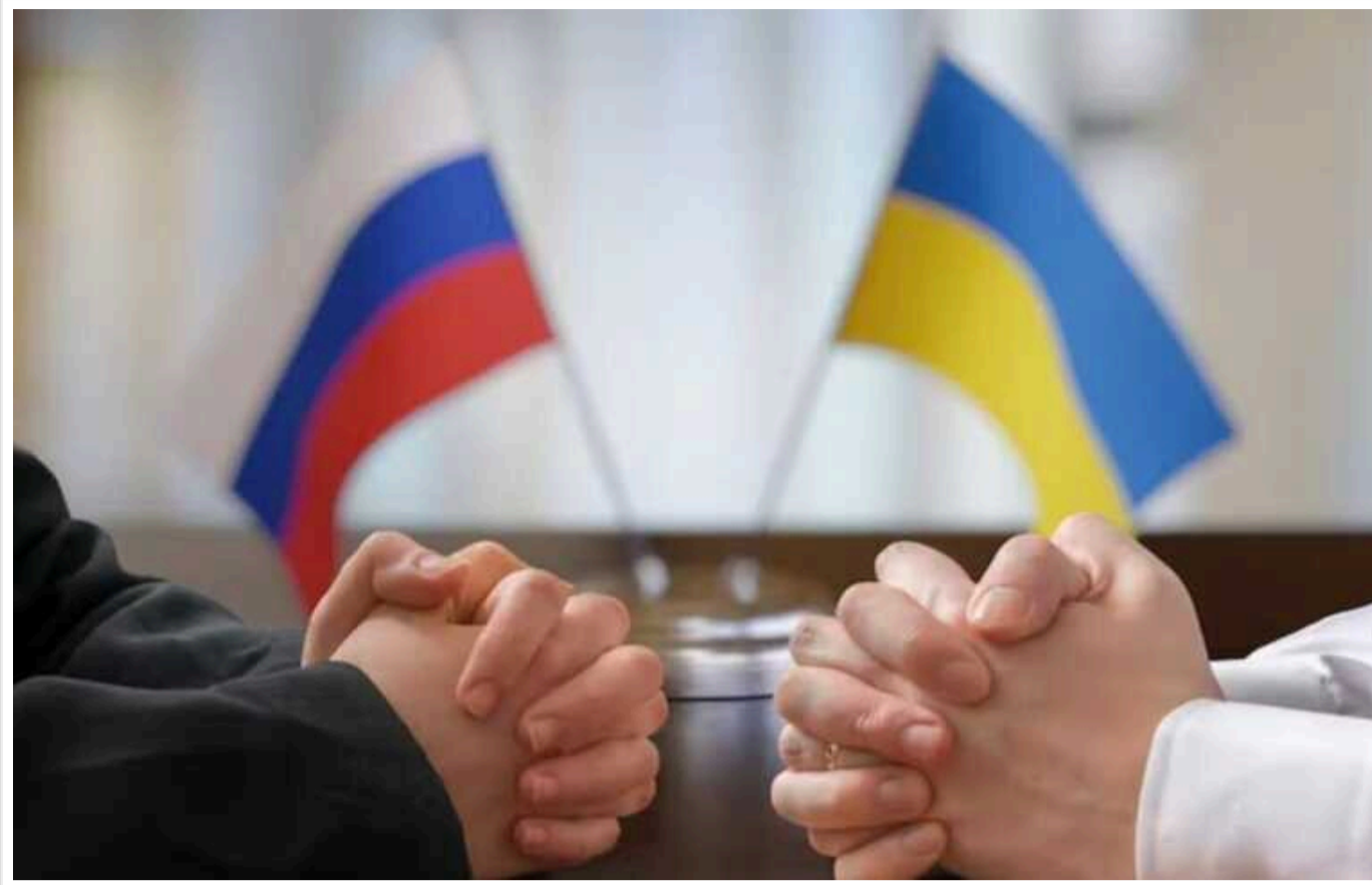
Українські офіційні особи почали думати про перспективу переговорів у майбутньому, – FT