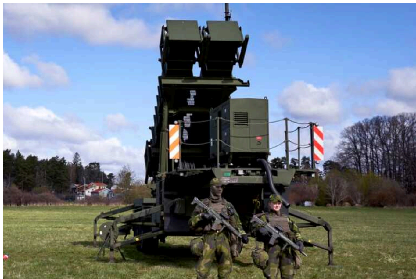
Німеччина виділила новий пакет допомоги Україні: IRIS-T, HIMARS та бронетехніка

Німеччина виділила для України новий пакет військової допомоги. Він включає системи ППО IRIS-T, реактивні системи залпового вогню HIMARS і танки Leopard 1.