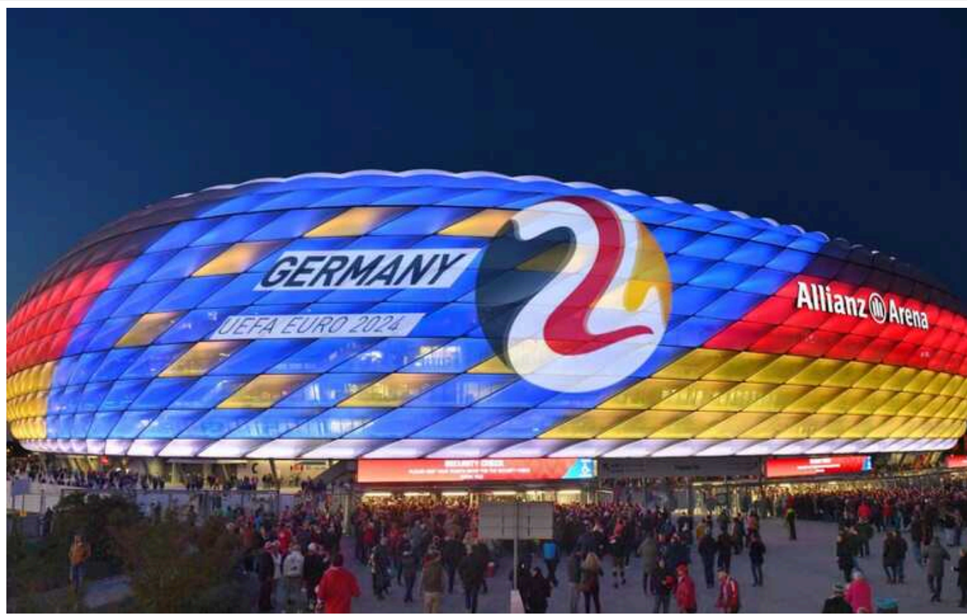
У Німеччині під час чемпіонату Європи збірну України з футболу буде взято під особливу охорону

Про це повідомила міністерка внутрішніх справ ФРН Ненсі Фезер газеті Bild.