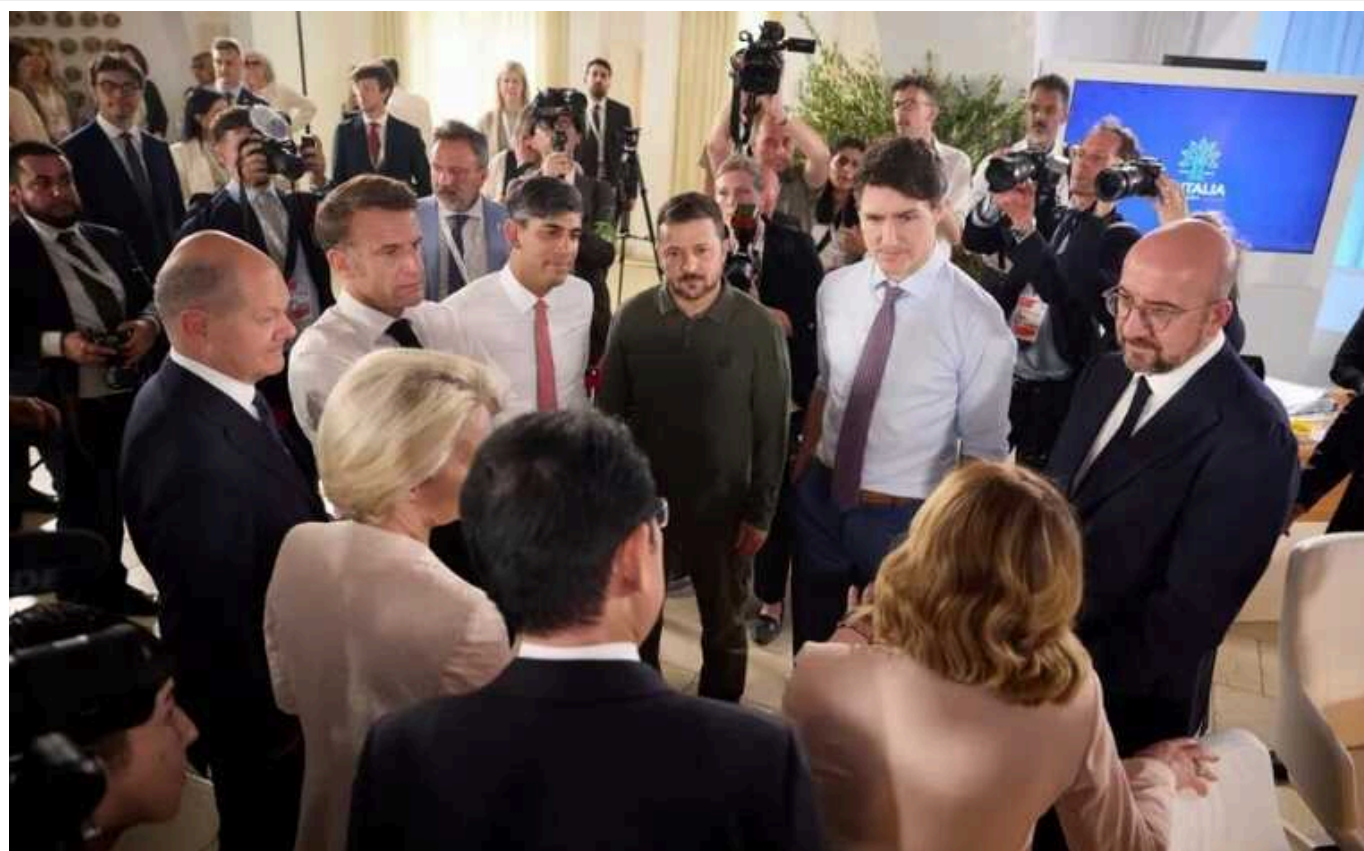
На саміті G7 Зеленський закликав захистити повітряний простір України

Президент України Володимир Зеленський закликав захистити повітряний простір України. Він попросив партнерів зробити для цього все можливе.