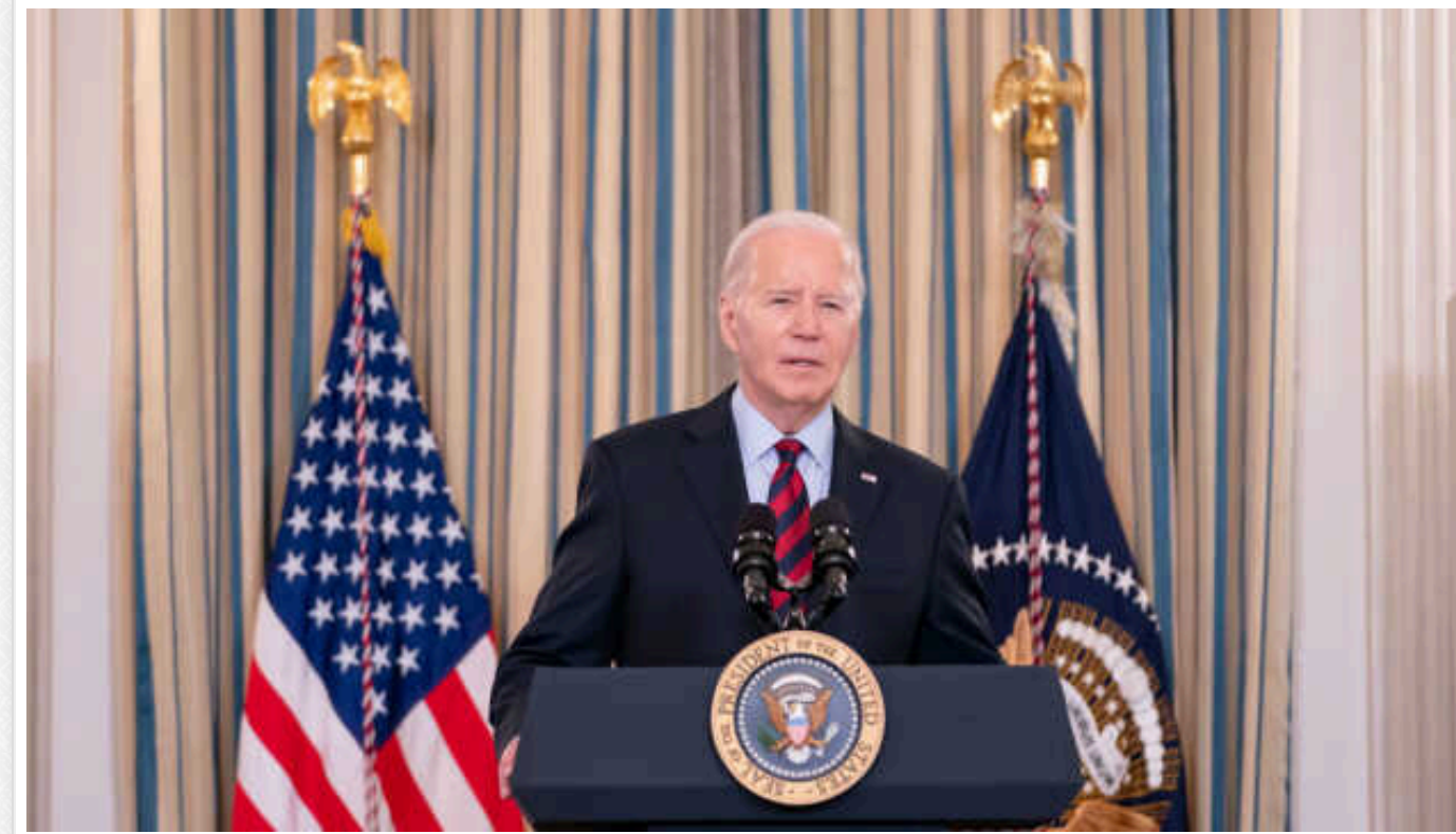
Угода про безпеку між США та Україною не передбачає відправлення американських військ до України, - Байден